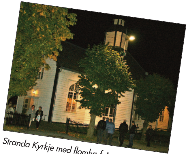
Stranda Kyrkje med flomlys frå rotaryklubben.