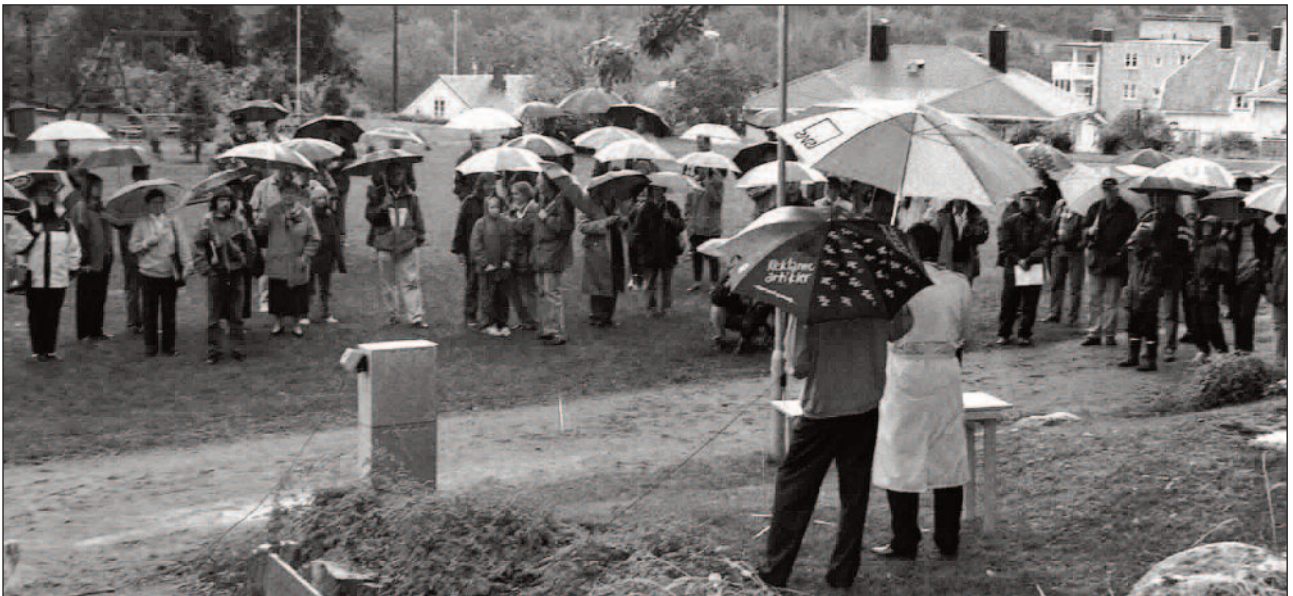
Trass ruskevêr møtte folk fram til opninga av Fløten Park, gjerne omtala som Rotaryparken.