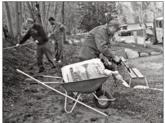
Medlemene stilte opp til dugnad uansett vær.